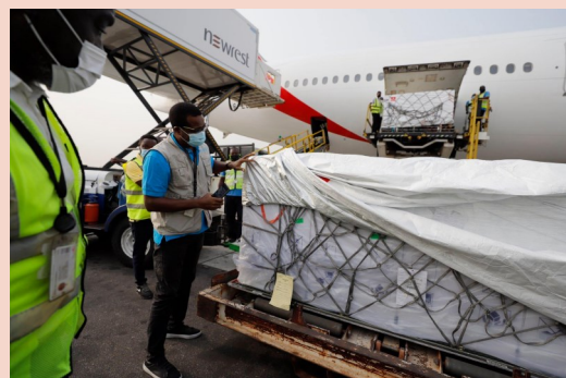
Vaccine ankommer med fly