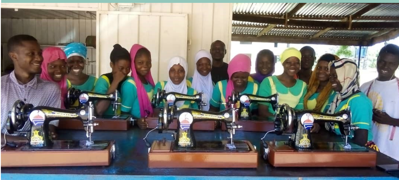
Fremvisning af de nye symaskiner

Der har været stor tilslutning til syværkstedet: Der går nu 25 elever, hvoraf 20 er kvinder og 5 er mænd. Det store antal elever hænger bl.a. sammen med, at familierne ser uddannelsen, der er gratis, som en mulighed for at hjælpe de unge til en fremtidig indkomst. Her har Covid-19 også øget interessen for denne mulighed for familierne. Støtten til YHCG får således en betydning for lokalsamfundet. Det store antal nye elever og det, at en del af symaskinerne efterhånden var ret slidt, gjorde, at vi besluttede at hjælpe, og i maj '21 har vi kunnet finansiere indkøb af 6 nye håndsymaskiner til syværkstedet. Der er stor taknemmelighed i Ghana, og de optog en lille video med takketaler til os.